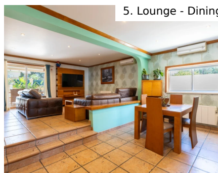
5. Lounge - Dining