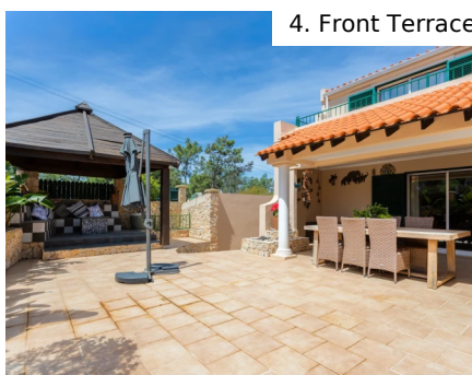
4. Front Terrace