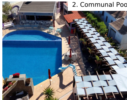
2. Communal Pool