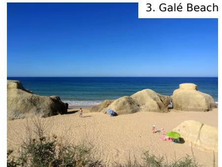
3. Galé Beach